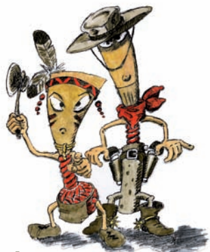
4 Dessin : Serge Haerrig

Classes : hautbois de Serge Haerrig et André Sablon et basson de Sylvie Villedary