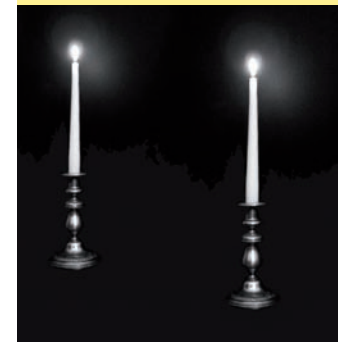
Visuel Marie LLano

En collaboration avec les Trinitaires Entrée gratuite dans la limite des places disponibles